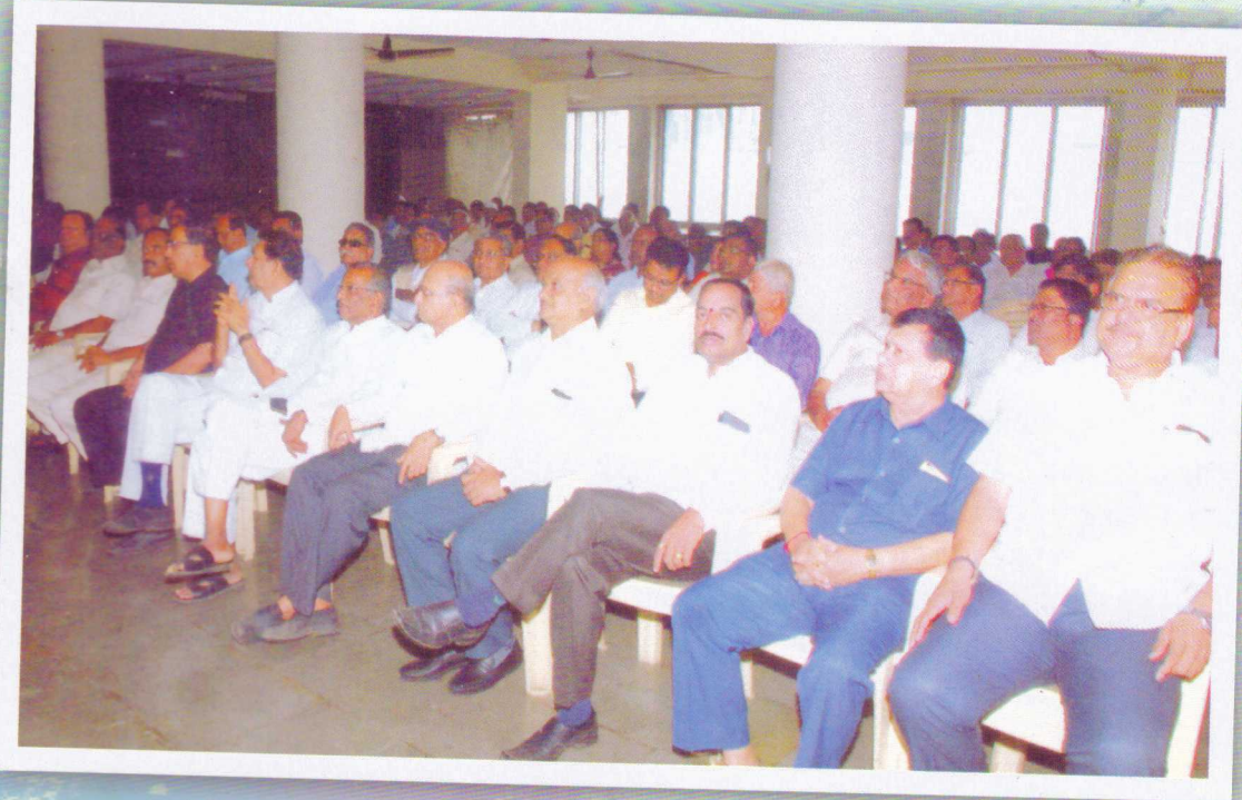
असोसिएशनच्या विविध प्रशिक्षण कार्यक्रमांना सतत भरघोस प्रतिसाद. बँकांचे उपस्थित पदाधिकारी व अधिकारी