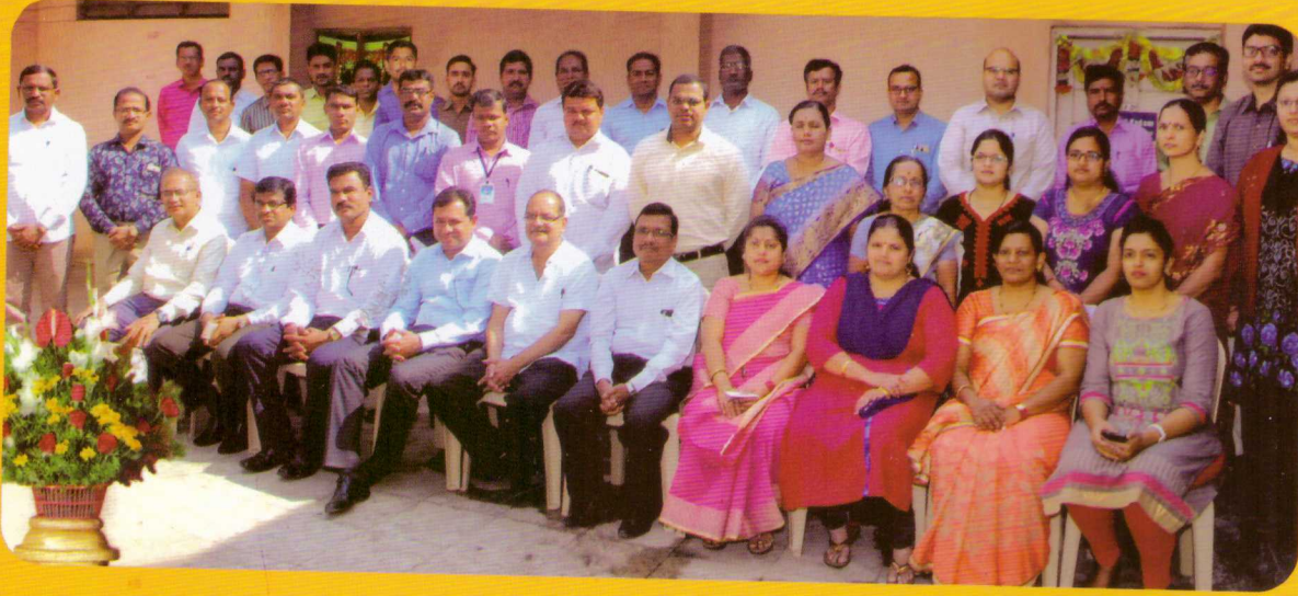
ताळेबंद, नफा तोटापत्रक वाचन, अनुत्पादक जिंदगी तरतुद व कर या विषयावर प्रशिक्षण कार्यशाळा प्रसंगी सभासद बँकांचे प्रतिनिधी